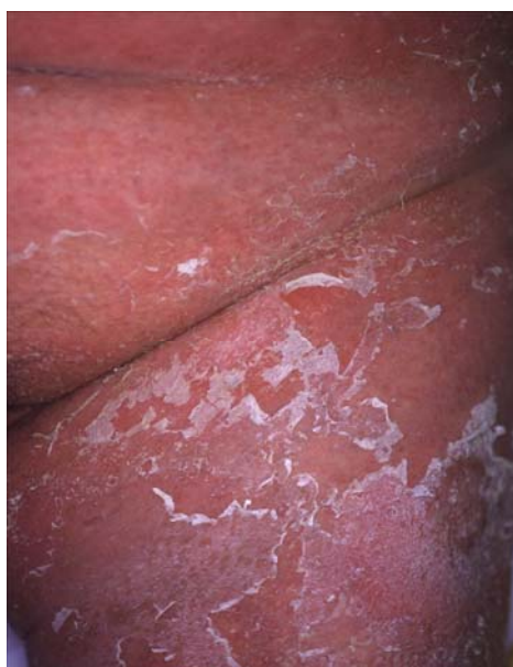
図 4 : AGEP の臨床