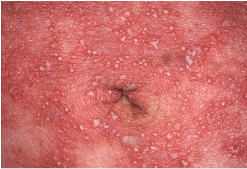
散在、融合する小膿疱