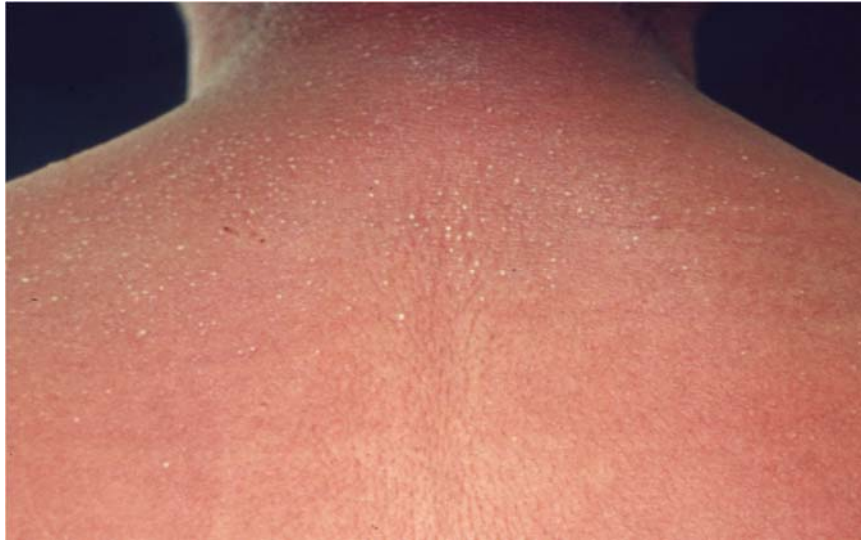
図 7 : AGEP の臨床像

(入院時検査所見) : 白血球 15500/\mu\text{L} (好中球 86.0%、好酸球 5.0%、単球 3.5%、リンパ球 4.5%、異型リンパ球 1%)、赤血球 474 \times 10^4/\mu\text{L} 、Hg 14.4g/dL、Ht 42.0%、血小板 20.1 \times 10^4/\mu\text{L} 、血沈 83/114、AST 24 IU/L、ALT 19 IU/L、ALP 205 IU/L、LDH 517 IU/L、BUN 33.4 mg/dL、Cr 1.2 mg/dL、CRP 15 mg/dL 以上、ASO (anti-streptolysin O antibody) 44 IU/mL、ASK (anti-streptokinase antibody) 160x. (倍)、各種ウイルス (単純ヘルペス、水痘-帯状疱疹ウイルス、Epstein-Barr ウィルス、サイトメガロウイルス) 抗体価に有意な所見なし。細菌学的検査; 背部の小膿疱・血液より一般細菌の検出なし。咽頭 : 常在菌のみ。左足背部 : Streptococcus pyogenes (Group A) 検出。心電図および胸部レントゲン検査にて異常なし。