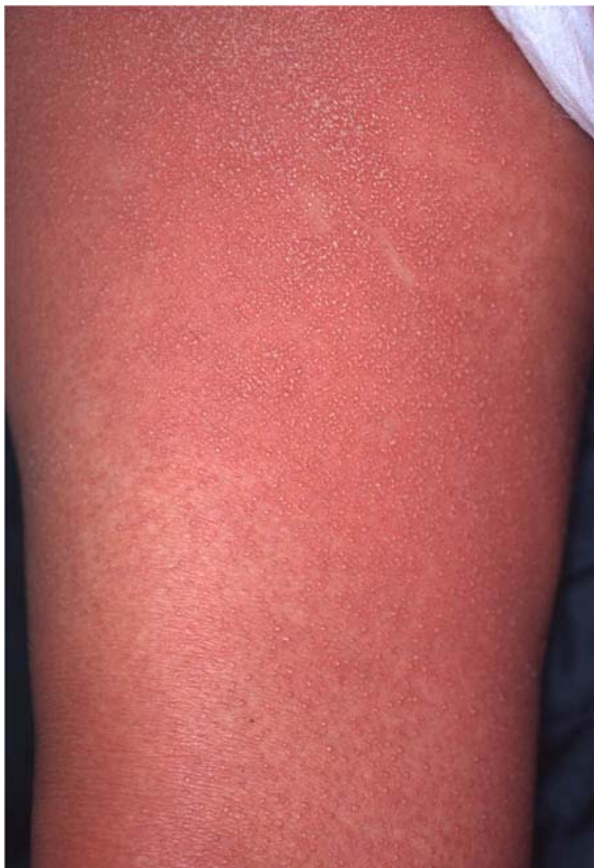
鼠径部～大腿部の皮疹