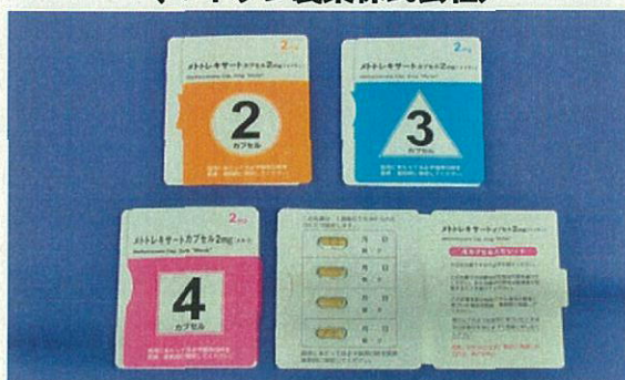
メトトレキサートカプセル2mg「マイラン」 (マイラン製薬株式会社)