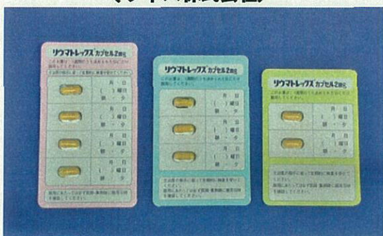
リウマトレックスカプセル2mg (ワイス株式会社)