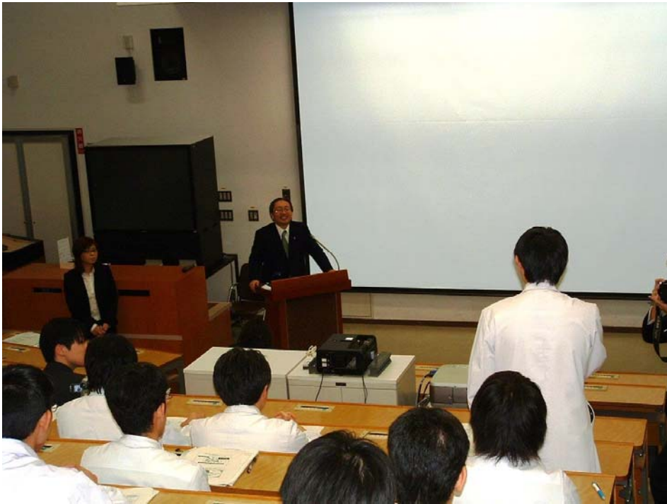
青森県知事による 弘前大学医学部学生への講演(上)