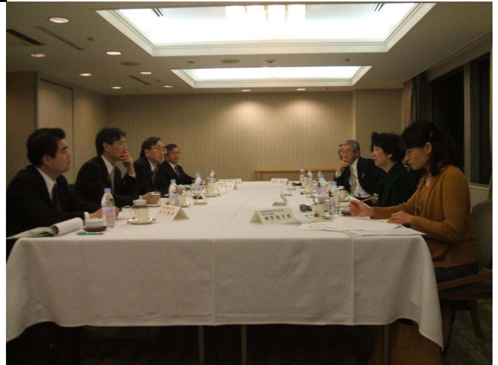
県外在住の医師等との地区懇談会(下)