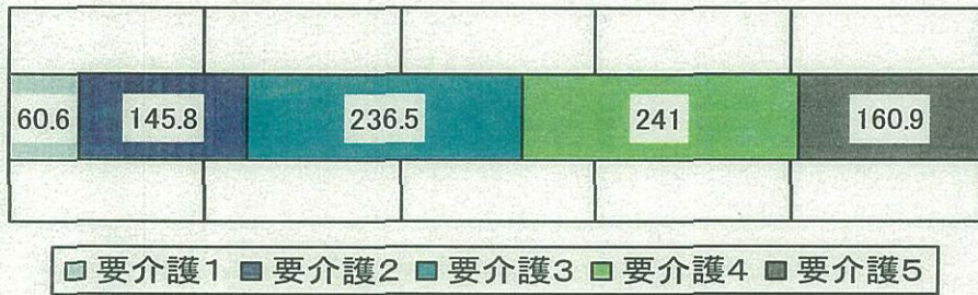
介護老人保健施設の利用者の状況(千人)