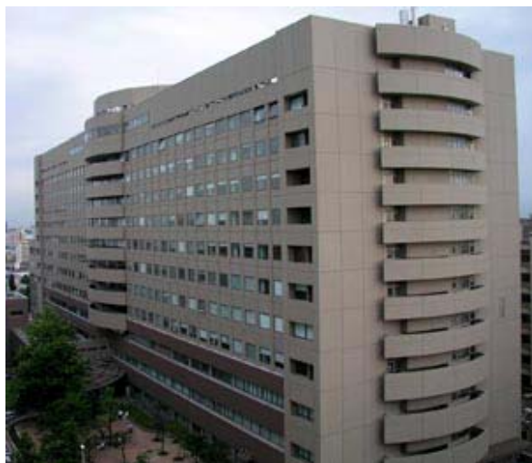
新潟大学医歯学総合病院