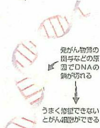
11 細胞のがん化のメカニズム

12 がん検診の受診率の推移 (地域保健・老人保健事業報告1, 2005年) 受診の対象となるのは、基本的には職場などでの検診の対象となっていない40歳以上の者。ただし、2004年より子宮がんは20歳以上の女性が、乳がんは40歳以上の女性が2年に1回受診することとなった。