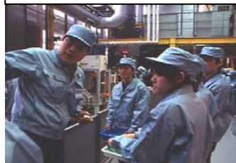
機械工作の仕事の体験風景