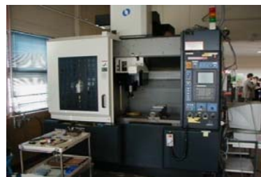
マシニングセンタ (2,500万円)[リース]