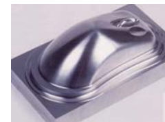
マシニングセンタによる加工例