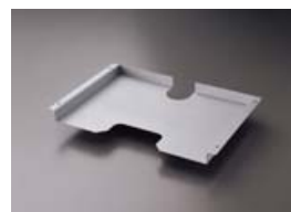
油圧プレス加工例