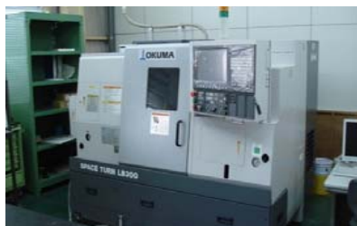
ターニングセンタ (2,000万円)