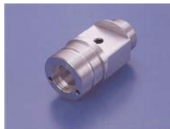
ターニングセンタによる加工例