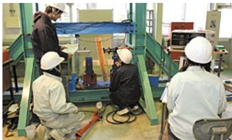
建築材料強度試験