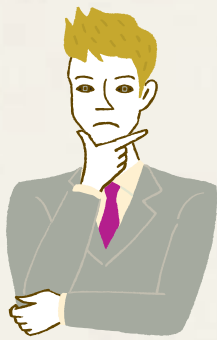
■ 現在（または直近）の賃金について [時給]

もちろん、簡単には、賃金アップは難しいかもしれないけれど、それでも今以上に頑張ってみる時給をアップする職に就きたいと思うか、今のスタイルに満足しているのか、このままでいいかと思うかは、自分自身の「なりたい姿」を考えて、判断してみてください。