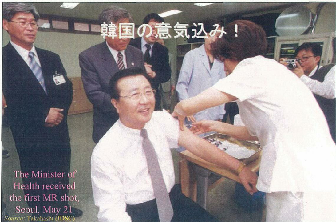
The Minister of Health received the first MR shot, Seoul, May 21