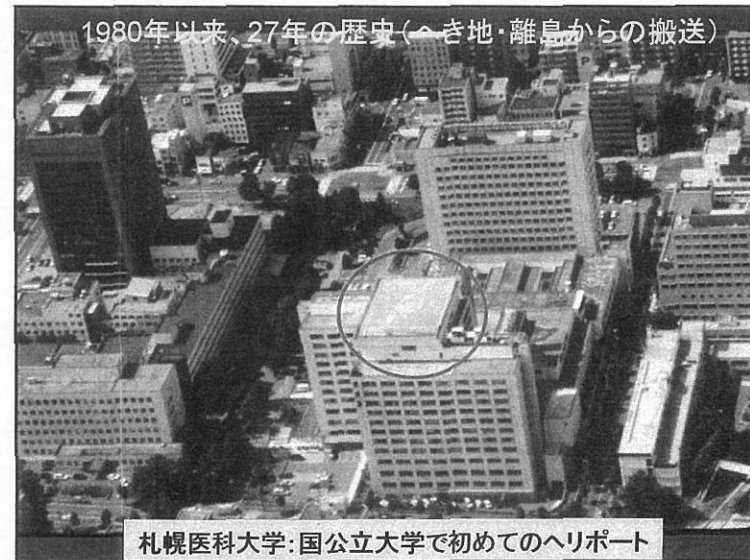
札幌医科大学: 国公立大学で初めてのヘリポート