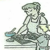
子育て支援 サービス