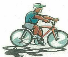
自転車置き場管理