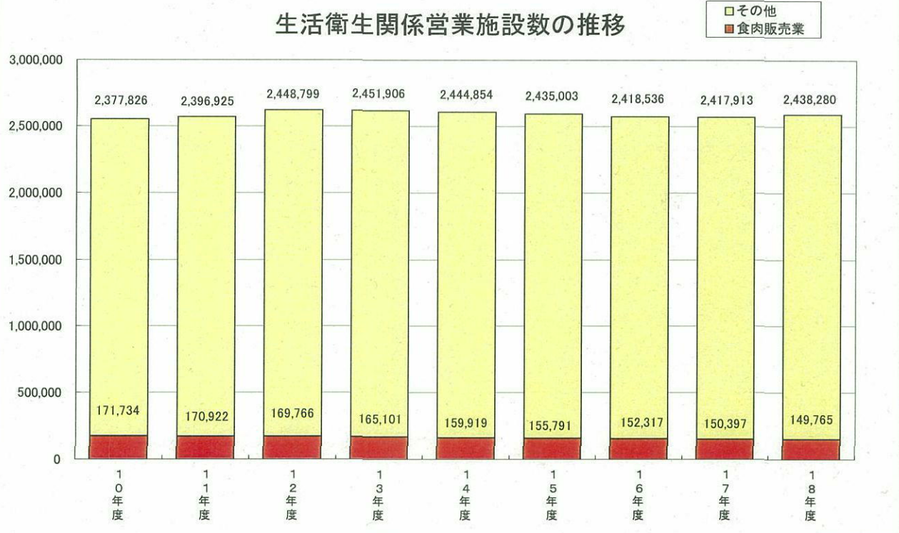
○18年度生活衛生関係営業施設数(平成19年3月末現在)