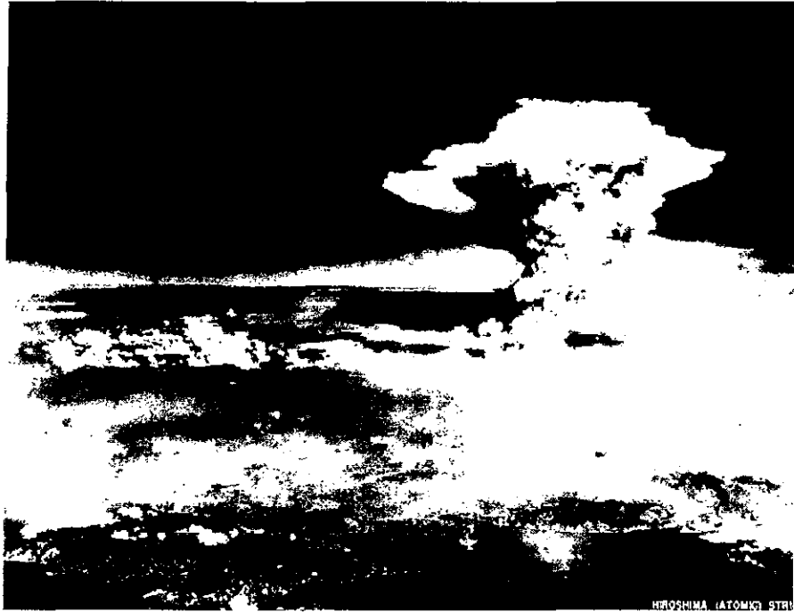
図3 広島原爆の原子雲