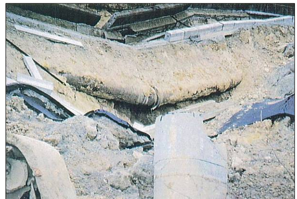
b) φ450 鋳鉄管 継手部抜け