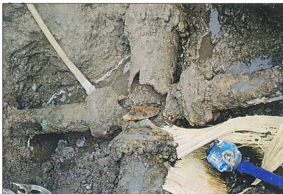
a) φ250×φ150 十字管 鋳鉄管 折損