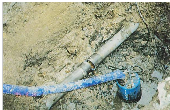
b) φ75 硬質塩化ビニル管 破損