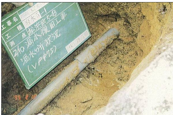
a) φ75 硬質塩化ビニル管 破損