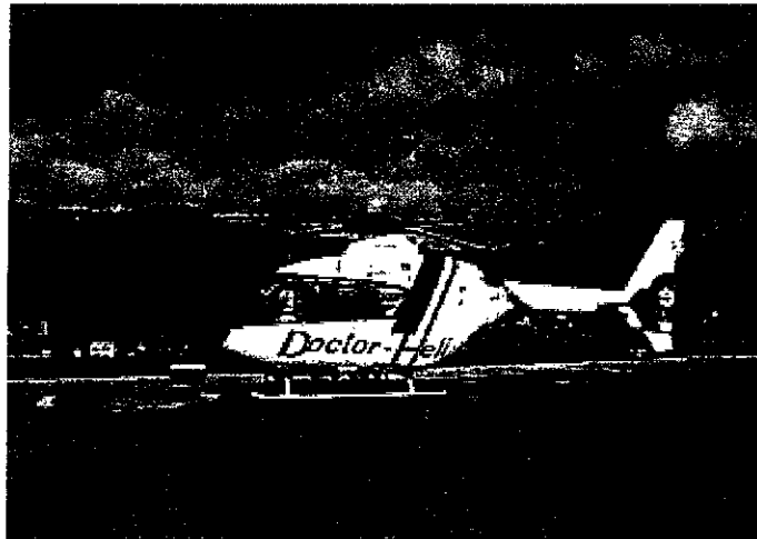
MD902の医療機器機内配置状況