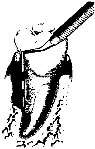
深い歯周ポケットと垂直性骨欠損