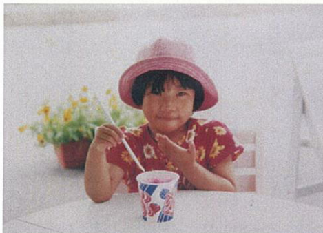
Y.S. さん 1997年8月生まれ 2002年10月発症 2006年10月永眠