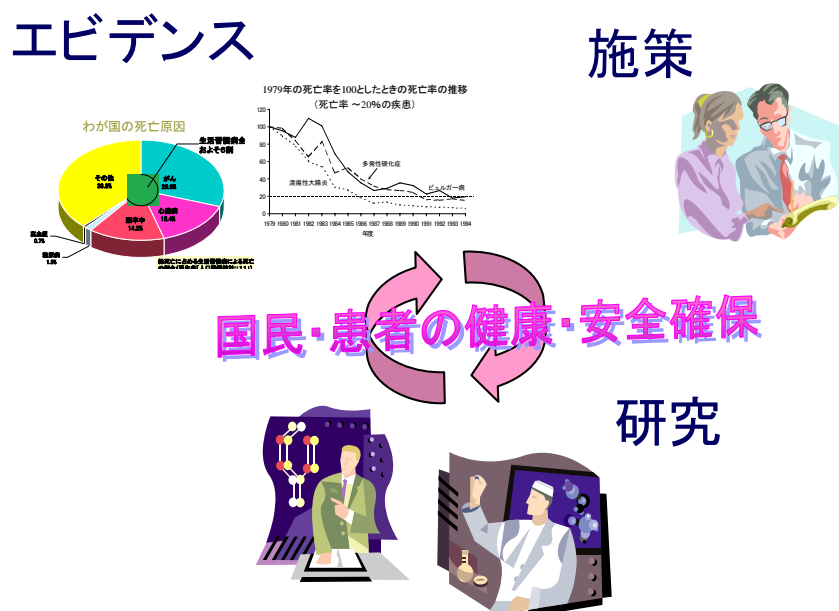
図1. 厚生労働科学研究と施策の関連性

厚生労働科学研究は、研究及びエビデンスの結果を施策に反映させ、また施策の成果をエビデンスとして把握し、国民の健康・安全確保を推進することを目指して実施されている。(図1参照)