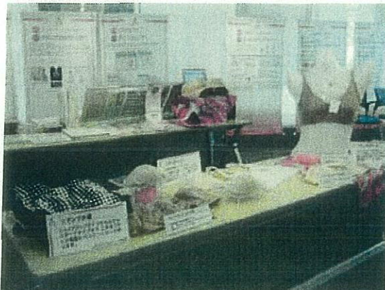
JNA プラザでの「乳がん特別企画展」(昨年)

「乳がん看護認定看護師」の他にも、「がん看護専門看護師」をはじめ、「がん性疼痛看護認定看護師」「がん化学療法看護認定看護師」「ホスピスケア認定看護師」が乳がん看護の領域で活躍しています。