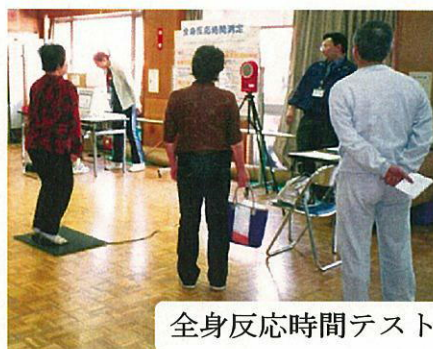
全身反応時間テスト