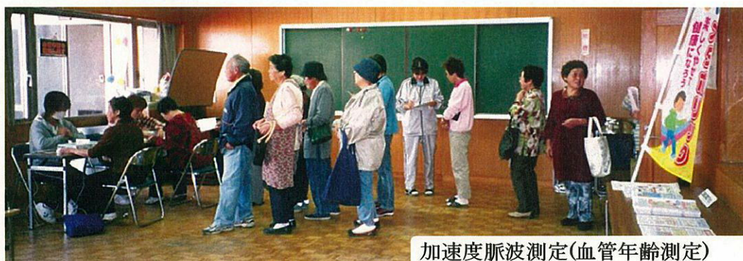
加速度脈波測定(血管年齢測定)