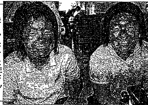
扶さん(右)と佐さん

祖父母のことが大好きな二人は小さな頃から自然にお年寄りと関わる仕事を目指していたという。共に上田千曲高校生活福祉科に進み、今年四月からうえだ敬老園に勤務している。