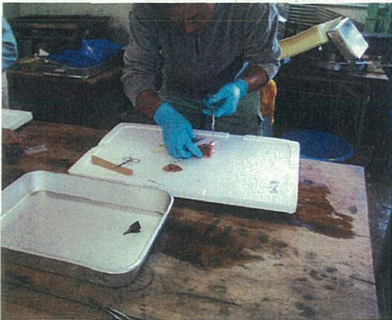
①各臓器摘出・寄生確認