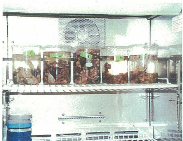
⑥インキュベーター内で消化