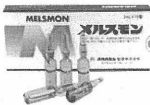
【注射薬 メルスモン】 美容(シミ・シワ・ニキビ・美白) 更年期障害・乳汁分泌不全 等