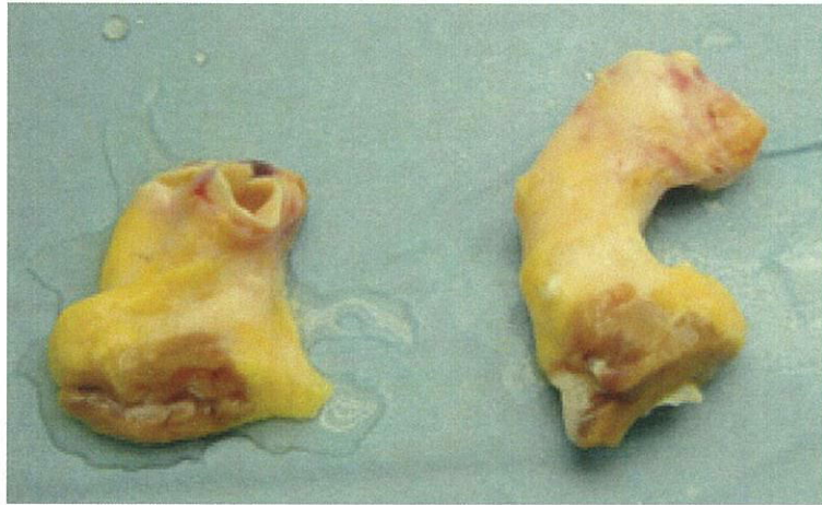
摘出されたヒト血管