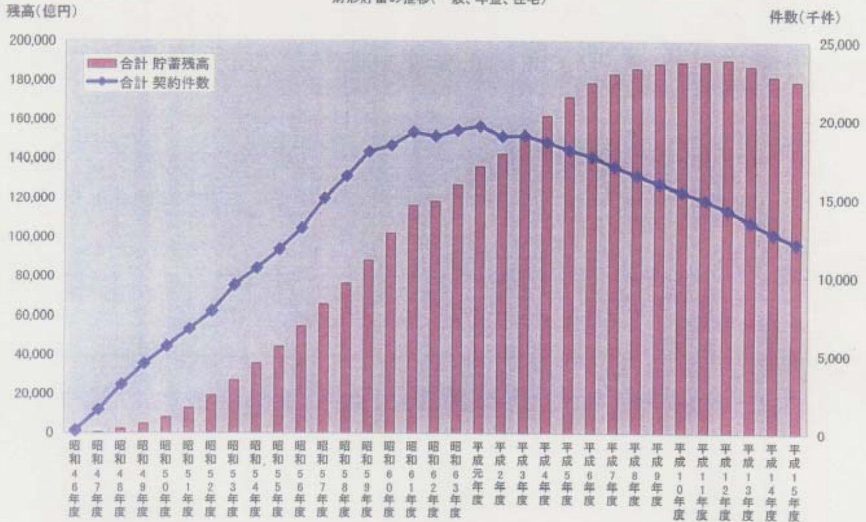
財形貯蓄の推移(一般、年金、住宅)