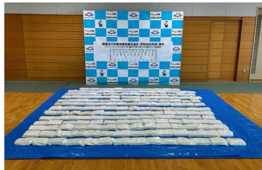
押収したコカイン

令和6年5月、第三管区海上保安本部等は、長期にわたる内偵捜査の結果、薬物密輸企図を把握し、関係機関との合同捜査により小型船舶を利用した瀬取りによる薬物密輸入事犯を摘発し、日本人3名と外国人5名（イタリア人2名、トルコ人2名、ギリシャ人1名）を 麻薬及び向精神薬取締法違反（営利目的所持） の疑いで現行犯逮捕し、 コカイン約178kg（末端密売価格約44億円相当） を押収した。