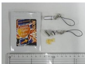
[Hight Men Monster]