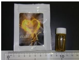
[ecstasy X shine]