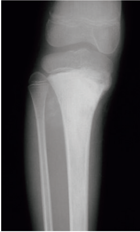
単純 X 線画像