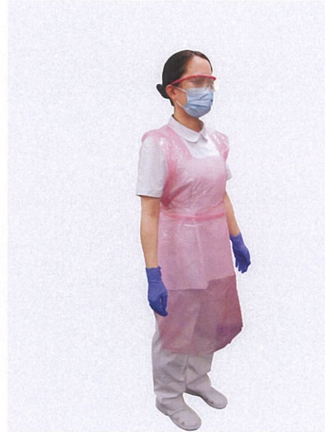
はっすいせい 撥水性のエプロン、マスク、 てぶくろ 手袋、ゴーグル