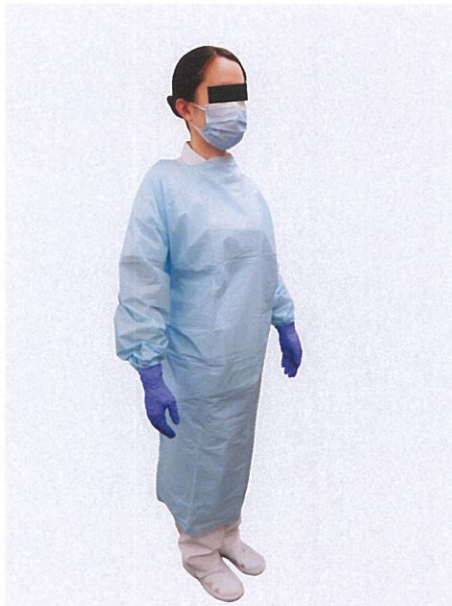
はっすいせい 撥水性のガウン、マスク、 てぶくろ 手袋