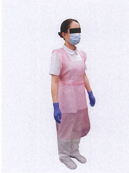
はっすいせい 撥水性のエプロン、マスク、 てぶくろ 手袋