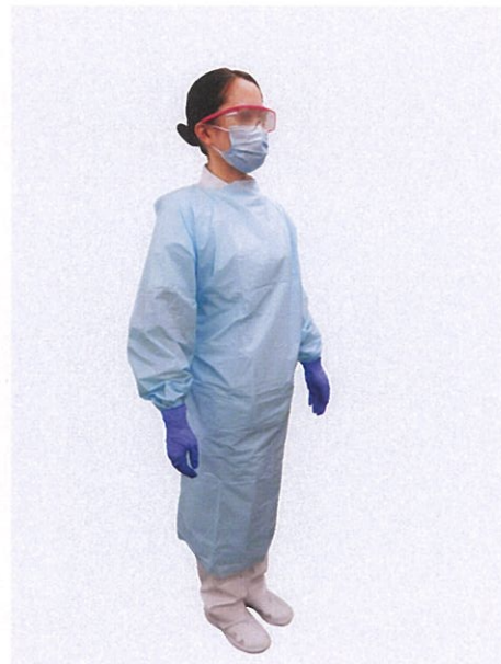
はっすいせい 撥水性のガウン、マスク、 てぶくろ 手袋、ゴーグル