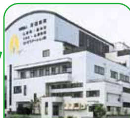
一般財団法人 河田病院 岡山市北区富町2-15-21