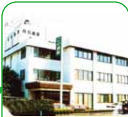
医療法人 国泰会 丹羽病院 岡山市東区東平島1036-3