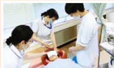
● 洗髪 of 技術演習