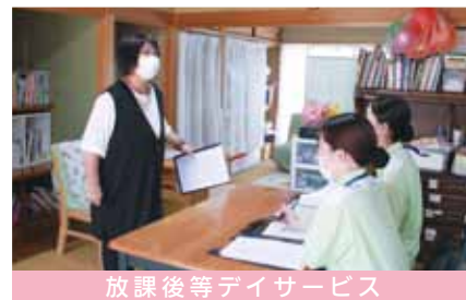
放課後等デイサービス