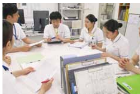
カンファレンス風景