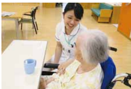
長島愛生園での臨地実習（老年看護学実習）