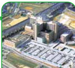
独立行政法人 国立病院機構 岡山医療センター 岡山市北区田益1711-1