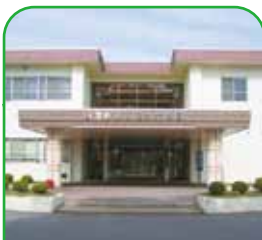
国立療養所 邑久光明園 瀬戸内市邑久町虫明6253