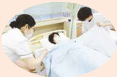
● ベッドメイキングの技術演習