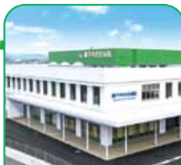
瀬戸内市立 瀬戸内市民病院 瀬戸内市邑久町山田庄845-1