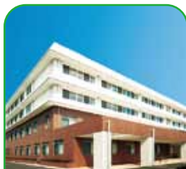
国立療養所 長島愛生園 瀬戸内市邑久町虫明6539