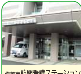
備前市訪問看護ステーション 備前市介護老人保健施設 備前さつき苑 備前市伊部2231-1