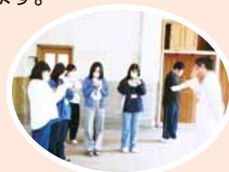
● フィールドワーク