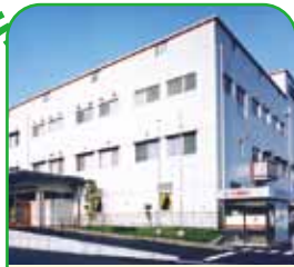
公益財団法人 操風会 岡山旭東病院 岡山市中区倉田567-1