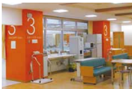
総合診療棟 3階病棟

多様な学生のそれぞれの能力を引き出し自ら考え 自ら切り開いていく力を身につける教育を大切にしています。