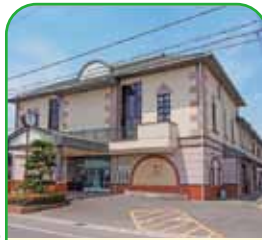
瀬戸内市地域包括支援センター 瀬戸内市社会福祉協議会 瀬戸内市邑久町山田庄862-1