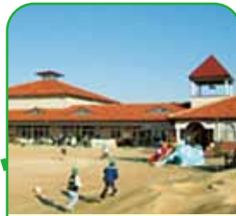
瀬戸内市立 邑久保育園 瀬戸内市邑久町尾張1159-1