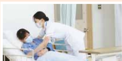
● 臨床看護技術演習