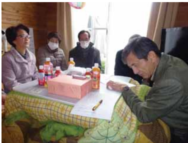
福島県ヒアリングの様子