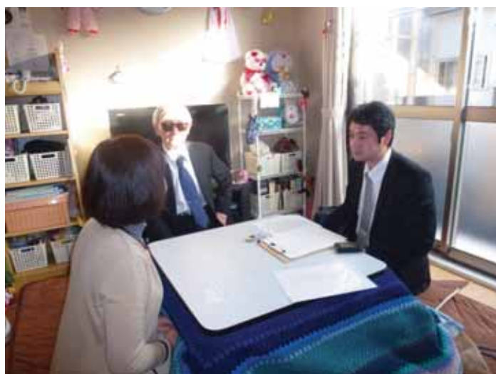
・宮城県ヒアリングの様子