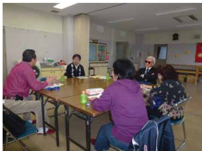
・宮城県ヒアリングの様子