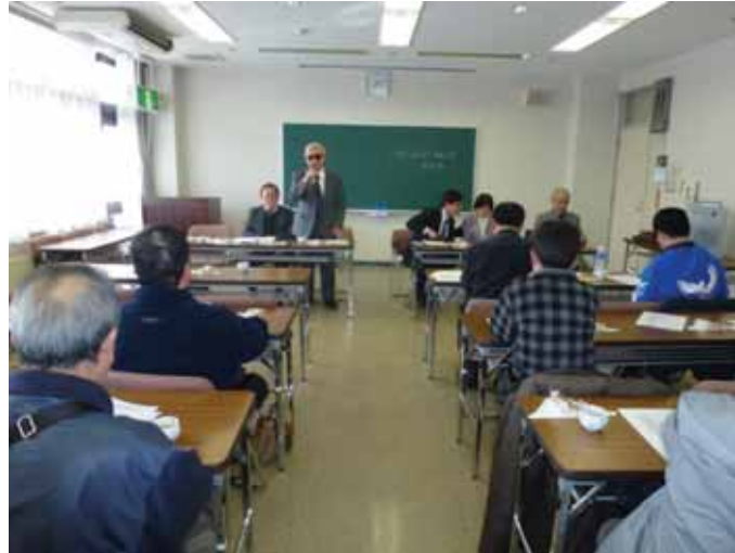
・岩手県ヒアリングの様子