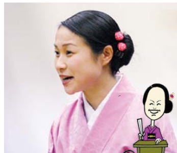
○講談台本作成/ 一般社団法人成年後見事務所アンカー

2006年12月から横浜市社会福祉士会と協働し、成年後見制度を講談として語る。以後、全国各地で「成年後見講談」を実施し、好評を得ている。