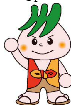
川口市社会福祉協議会マスコット 社助（しゃすけ）