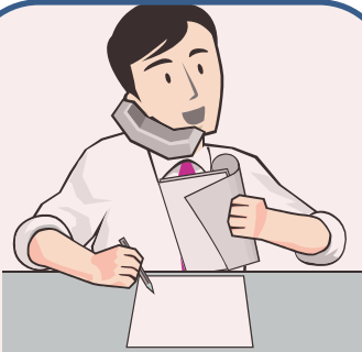
相談支援 (日々の相談)