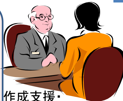
作成支援・ 活動支援・活動報告 (専門職による対応)