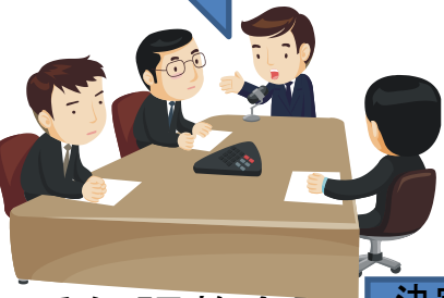
受任調整会議 (府社協に設置)