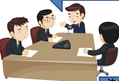
受任調整会議 (府社協に設置)