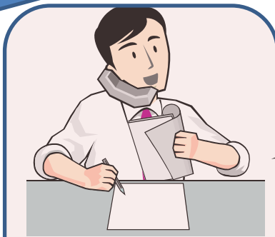
相談支援 (日々の相談)