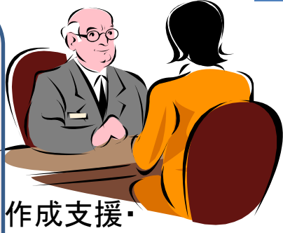
作成支援・ 活動支援・活動報告 (専門職による対応)