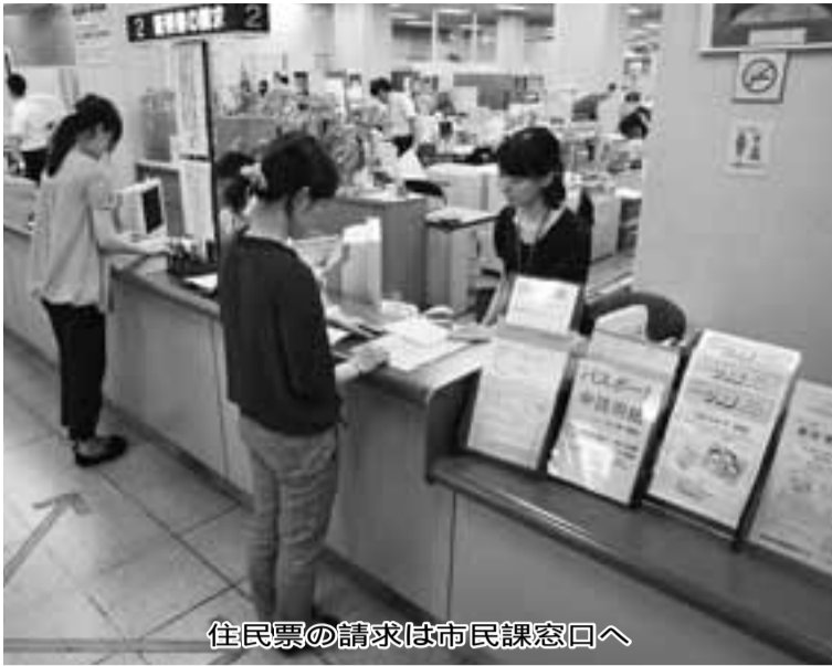
住民票の請求は市民課窓口へ

在留資格の変更や在留期間の更新、在留カードの更新、氏名の変更や国籍などの変更手続きは、入国管理局(大阪市西6区4-7-3・2100)に届け出てください。特別永住者の手続きは市役所本館1階(市役所本館1階)に届け出てください。【引越しの際には、転出届が必要】住所異動届や印鑑登録に関する手続きが、市民課に加え、各支所でもできるようになりました。また、市外への引越しのときは、転出届が必要となります。特別永住者証明書、在留カードまたは外国人登録証明書と併せて、引越し先の市町村へ実際に住み始めた日から14日以内に届け出てください。