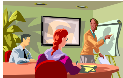
随時 登録者研修・受任者会議等