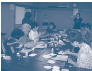
▲おしゃべりサロンで手作りの花瓶作りを楽しまれる豊島校区の皆さん