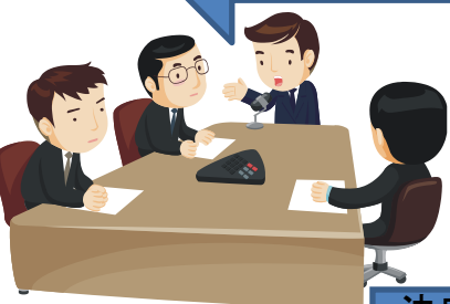
受任調整会議 (府社協に設置)