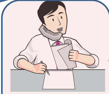
相談支援 (日々の相談)