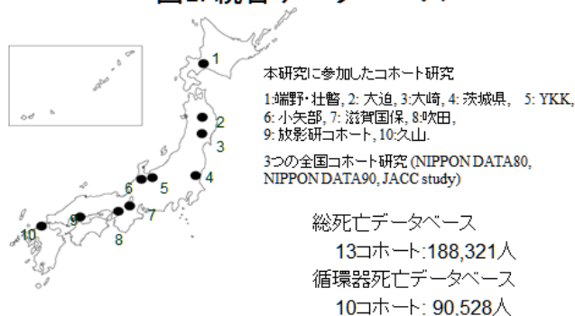
図1. 統合データベース

EPOCH-JAPAN Evidence for Cardiovascular Prevention from Observational Cohorts in Japan Study わが国におけるコホート研究のデータを統合、解析するプロジェクト コホートの条件: 健康項目がある、10年前後の追跡、1,000人以上