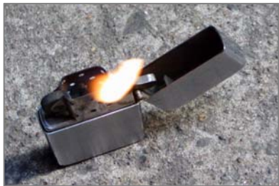
オイルライター ライターの芯が石綿できている時代がありました。(ライター使用によるばく露はありません)