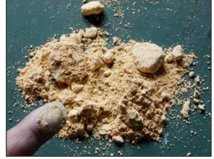
不純物(タルク・水練り保温材等)