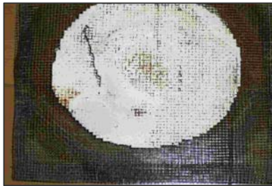
石綿つき金網 理科の実験用金網(写真はノンアス品)。