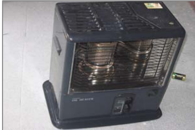
石油ストーブの芯 以前の石油ストーブの芯は石綿布を主材として製造されていました。平賀源内の燃えない布(火浣布)の原点です。

●同じく「豆タンあんか」「懐中カイロ」「風呂釜」「火鉢の灰」などにも石綿が使用されていたという文献があります。