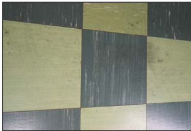
石綿含有ビニル床タイル