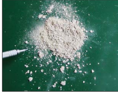
石綿含有パーミキュライト(ひる石)