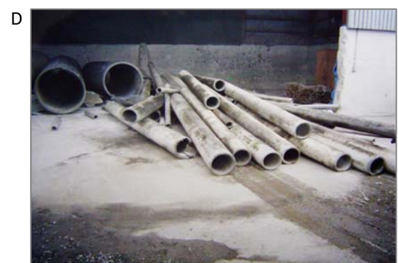
③ 水道管の集積。尚、石綿セメント管という標記は上下水道用、石綿セメント円筒という標記は煙突など建築用に用います。