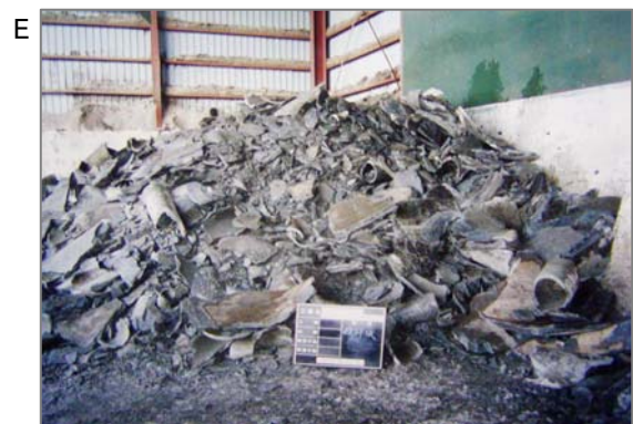
④ この後に産業廃棄物として、粉碎して処分場に埋め立てられます。粉碎、埋め立て時に粉じんがかなり発生します。