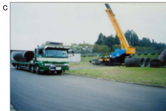
② ①の水道管の現在の撤去風景。振動により破損し、粉じんが飛散することがないよう、丁寧に運搬する必要があります。