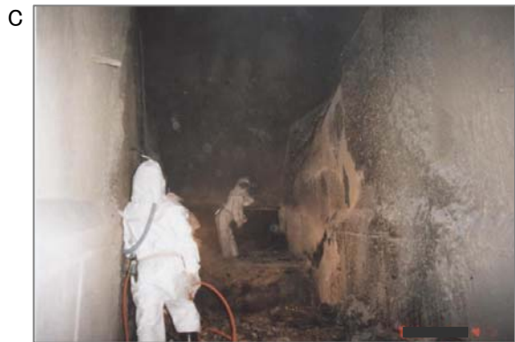
同上、炉内でのクリンカ除去作業。表面を除洗したり、ワイヤーブラッシングしたりします。この他に古いパッキングの交換や保温材の撤去、更新などの石綿取扱い作業を行います。