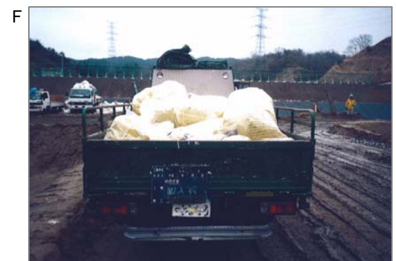
石綿(特別管理産業廃棄物)の収集・運搬・最終処分風景。石綿の入った袋が破れないように慎重に積み込み、運びます。