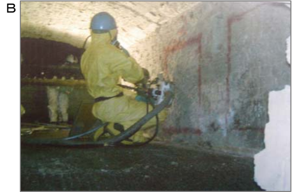
写真は焼却炉内の石綿含有不定形耐火物のクリンカ(すず等附着物)除去作業です。クリンカ除去時に耐火物の一部を破損し、石綿粉じんが発生する可能性があります。