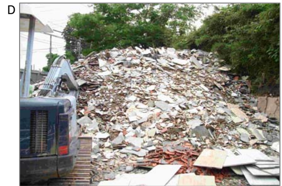
瓦工業者の廃材置き場です。石綿の含まれない日本瓦と石綿含有屋根材が混在して捨てられていました。重機などを用いた積み替え等は、粉々になり、粉じんが飛散しますので注意が必要です。