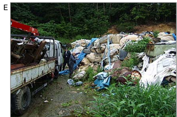
不法投棄現場。ゴミ袋から石綿疑い物質が出てきました。このほか石綿が使用された電気製品など雑多なものが多く捨ててあります。人目につきにくい場所への投棄が多いですが市街地の近辺、という例もあります。