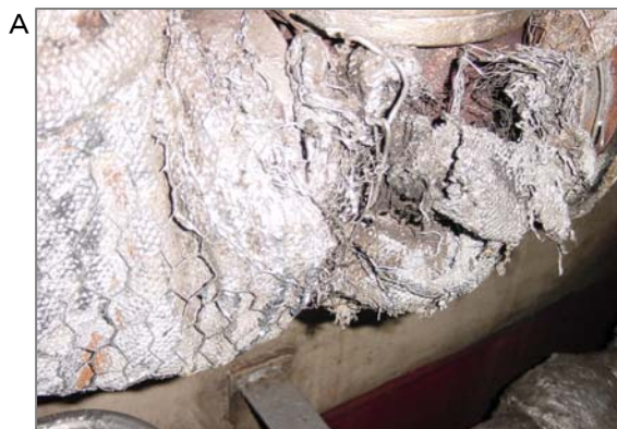
機関室の配管の石綿含有保温材です。写真のように劣化して毛羽立っている場合は、飛散の危険性があります。