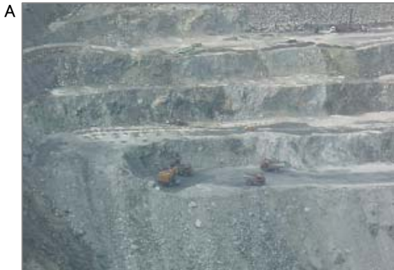
【概要】写真は海外の石綿鉱山(露天掘り)です。地下掘りの鉱山もあります。我が国の石綿鉱山は昭和20年代までに多くが閉山し、現在、石綿鉱山はありません。また蛇紋岩系の採掘場では不純物として白石綿が混入している可能性があります。