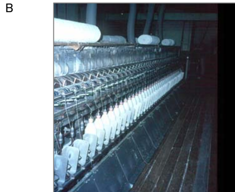
石綿紡織工場。石綿のグレード(品質)の高いもの(長繊維)を開綿・均一にして撚り合わせて糸にします。綿羊(コットン)などと同じ製法です。工場内は相当な粉じんが舞っていたところもありました。