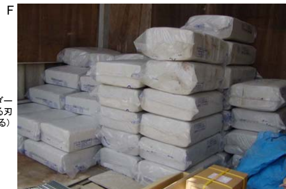
吹きつけ石綿用に工場で調合された梱包形態(ビニールで圧縮梱包されています)。昔の原綿輸入は麻袋や紙袋に入っており梱包が破れてばく露した、などのケースがありました。