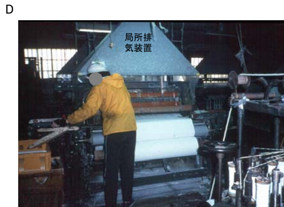
ローラーにかけ所定の厚みにしているところ。写真は石綿の飛散を防ぐため局所排気装置がつけられています。石綿布はタテ糸、ヨコ糸を背広などの生地製造と同じように織りました。