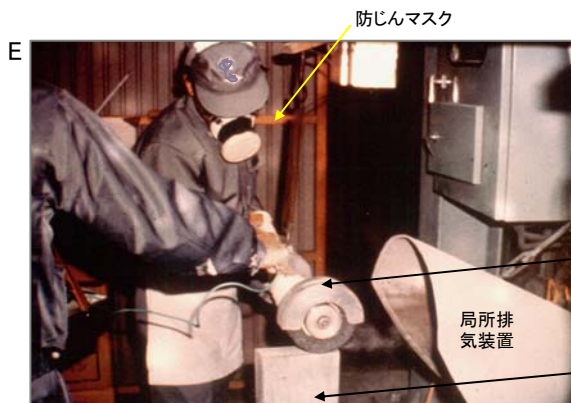
グラインダーで石綿含有物を研磨しています。写真は局所排気装置がつけられており、粉じんは効率よく排気されていますが、浮遊した繊維にはく露するので防じんマスクも必要です。