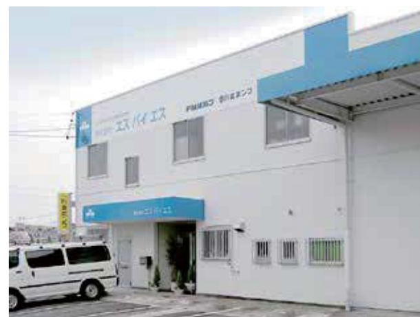
静岡、富士、浜松の3拠点体制で 静岡県全域をカバーし、事業を展開しています

設立時に目指したのは、社員が働きやすく、笑顔が絶えない明るい職場です。その目標を実現するため、休暇制度の充実にも努めています。