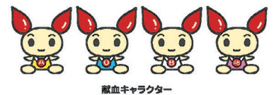
献血キャラクター