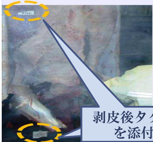
剥皮後タグ等を添付