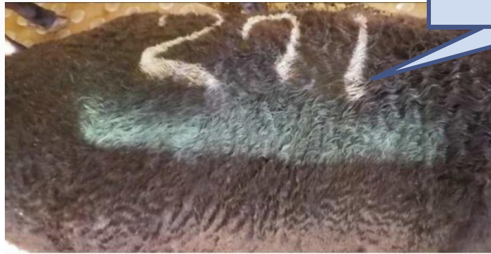
スプレー・タグによる識別